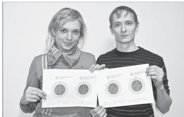
Самые меткие работают на ОФ «Северная»