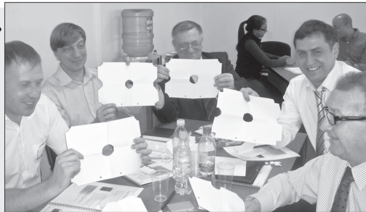
Рабочие моменты семинара

Это нахождение пути для обеспечения безопасности, прежде всего и всегда.