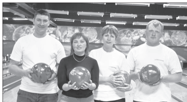
Дружная команда шахты «Берёзовская»

Елена ТРОФИМОВА